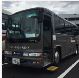
【UNIVERSAL STUDIOS JAPAN】