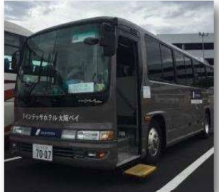
[UNIVERSAL STUDIOS JAPAN]