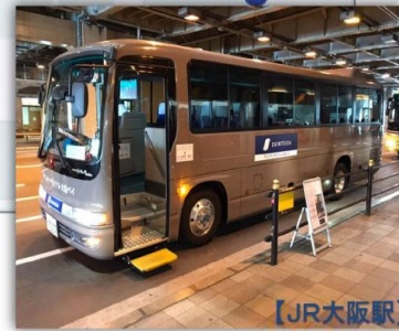
【JR大阪駅】 JR Osaka Sta.

【無料シャトルバスをご利用のお客様へ】 無料シャトルバスは当ホテルをご利用の方に限らせていただきます。団体様でのご利用はお断りする場合がございます。ご予約はお受けしていません。先着順のご案内となります。ご乗車開始の合図があるまで1フロアで並んでお待ちくださいませ。定刻運行を心がけております。出発時間に遅れないよう余裕を持ってお越しくださいませ。ご乗車開始までにお席が満席となる場合がございます。お乗り遅れもしくは満席の場合は次の便をお待ちいただくか公共交通機関をご利用くださいませ。車内での喫煙、飲食はご遠慮くださいませ。送迎時間は交通状況により多少前後する場合がございます。悪天候により運行できない場合がございます。皆さまのご理解とご協力をよろしくお願い申し上げます。